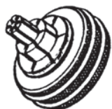
Таблица 3 – Расширительная насадка для трубок из нерж. стали