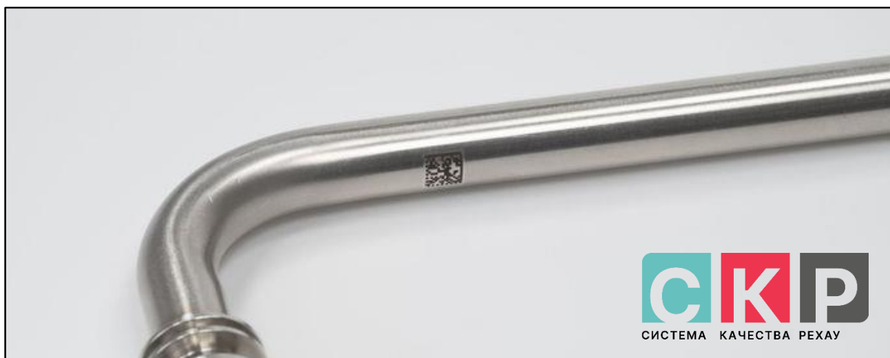
Рисунок 1 – DM код

1.3 Трубка Г-образная имеет маркировку с указанием: