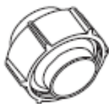
Таблица 4 – Резьбозажимное соединение для трубок из нерж. стали